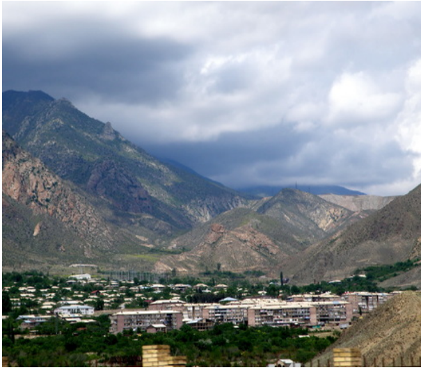
Նկար 2. Ագարակ քաղաք,

բնակչությունը կազմել է 4300 մարդ: Բնակավայրը հիմնադրվել է 1949 թ., որպես բանվորական ավան՝ կապված տարածքում օգտակար հանածոների մշակման հետ: