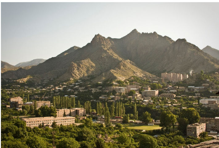
Նկար 1. Մեղրի բնակավայր

2015թ. տվյալներով Մեղրի բնակավայրի մակերեսը 3 կմ 2 է, իսկ, բնակչությունը՝ 600 մարդ: