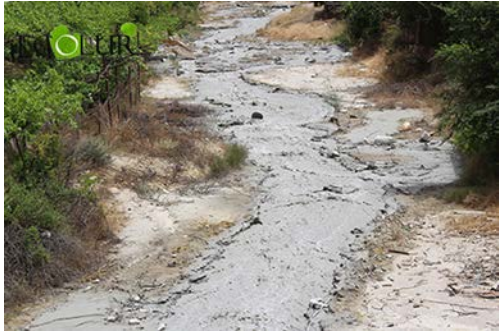
Նկար 5. Կարճևան գետը՝ աղտոտված