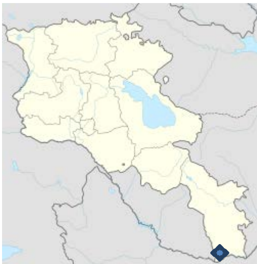
Քարտեզ 1. Սյունիքի մարզ, Մեղրի խոշորացված համայնք

«ԷկոԼուր» տեղեկատվական ՀԿ-ի «Հանքարդյունաբերության ազդակիր համայնքները՝ ԱՃԹՆ գործընթացի լիարժեք մասնակիցներ» դրամաշնորհային ծրագրի նպատակն է ապահովել ԱՃԹՆ-ի կատարումը քաղաքացիական հասարակության մասնակցության, հասարակական դեբատների անցկացման և հասարակության որոշումների կայացման գործընթացի մասնակցության ապահովմամբ: Որպես ծրագրի թիրախ ընտրված Լոռի, Գեղարքունիք, Սյունիք մարզերի հանքարդյունաբերությանն առնչվող համայնքներից (Լոռու մարզի Ախթալա (+Ճոճկան, Մեծ Այրում ), Շնող (+Թեղուտ), Գեղարքունիքի մարզի Սոսք, Սյունիքի մարզի խոշորացված Կապան համայնք (Գեղանուշ) Քաջարան համայնք (+Արծվանիկ, Սյունիք), Մեղրի համայնք (+ Ագարակ) հինգերորդ այցելությունը կազմակերպվել է դեպի Մեղրի խոշորացված համայնքի բնակավայրեր: Տես քարտեզ N1