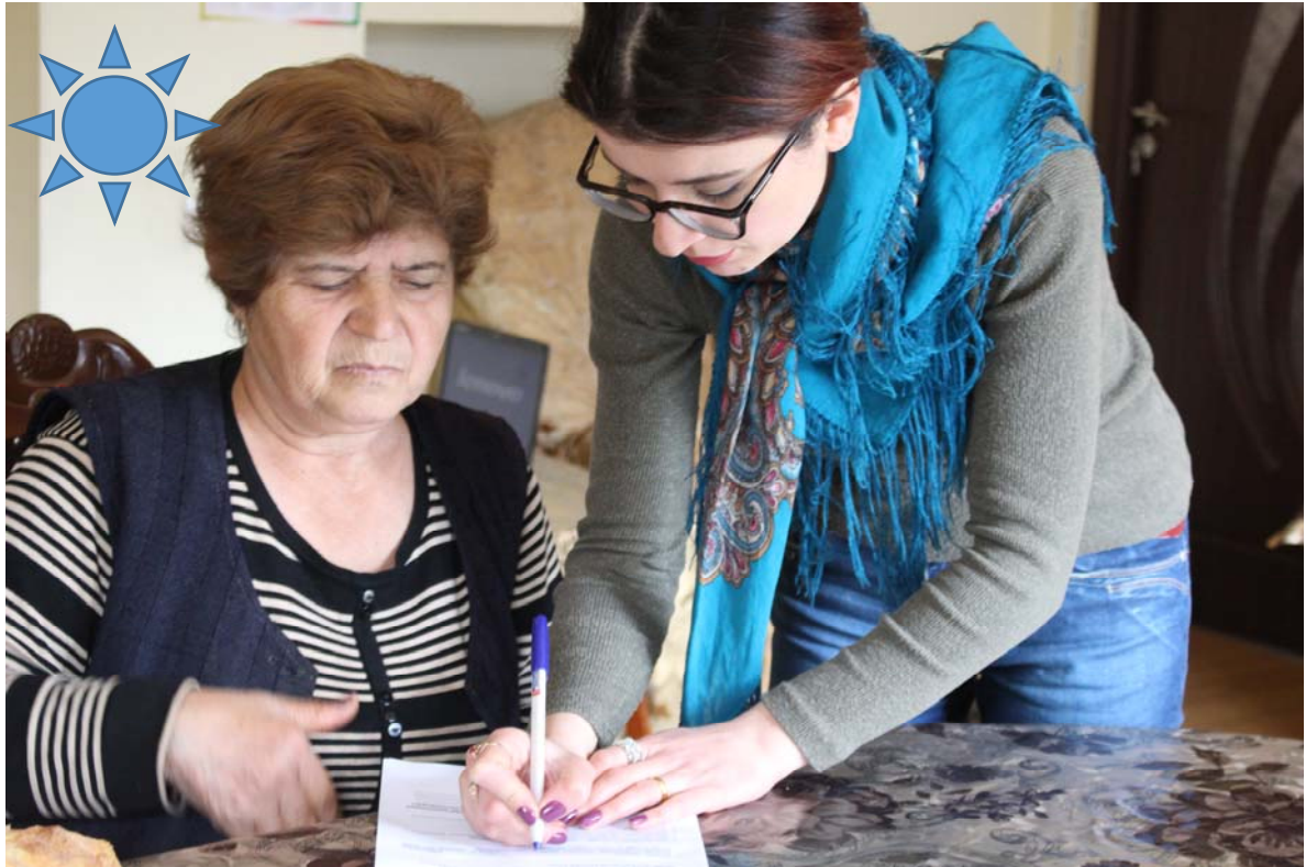
Նկար 3 Հարցազրույց Թեղուտի ընտանիքներից մեկում

Հարցազրույց վարվել է հողագործ, մանկավարժ, առևտրի աշխատող, համայնքապետարանի աշխատակից մասնագիտական խմբերի հետ: