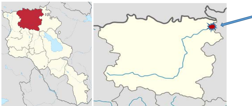
Նկար 1 Լոռու մարզ, Թեղուտ, Շնող

Որպես ծրագրի թիրախ ընտրված Լոռի, Գեղարքունիք, Սյունիք մարզերի հանքարդյունաբերությանը առնչվող համայնքներից (Լոռու մարզի Ախթալա (+Ճոճկան, Մեծ Այրում), Շնող (+Թեղուտ), Գեղարքունիքի մարզի Սոսք, Սյունիքի մարզի խոշորացված Կապան (+Քաջարան, Արծվանիկ, Սյունիք, Գեղանուշ բնակավայրեր), Մեղրի (+ Ագարակ)) առաջին այցելությունը կազմակերպվեց դեպի Թեղուտ և Շնող բնակավայրեր: Տես Նկար N1