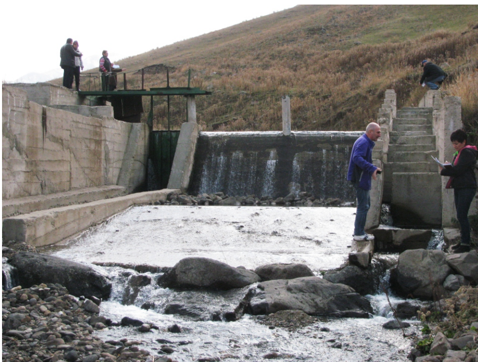
«Մարտունի» փոքր ՀԷԿ