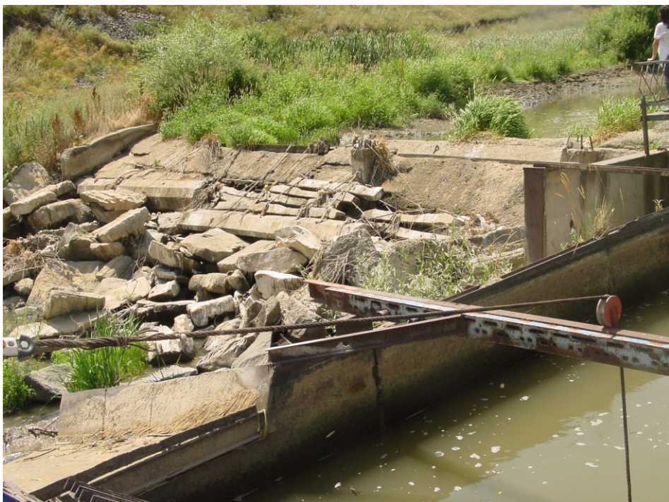
«Արջուտ-2» փոքր ՀԷԿ