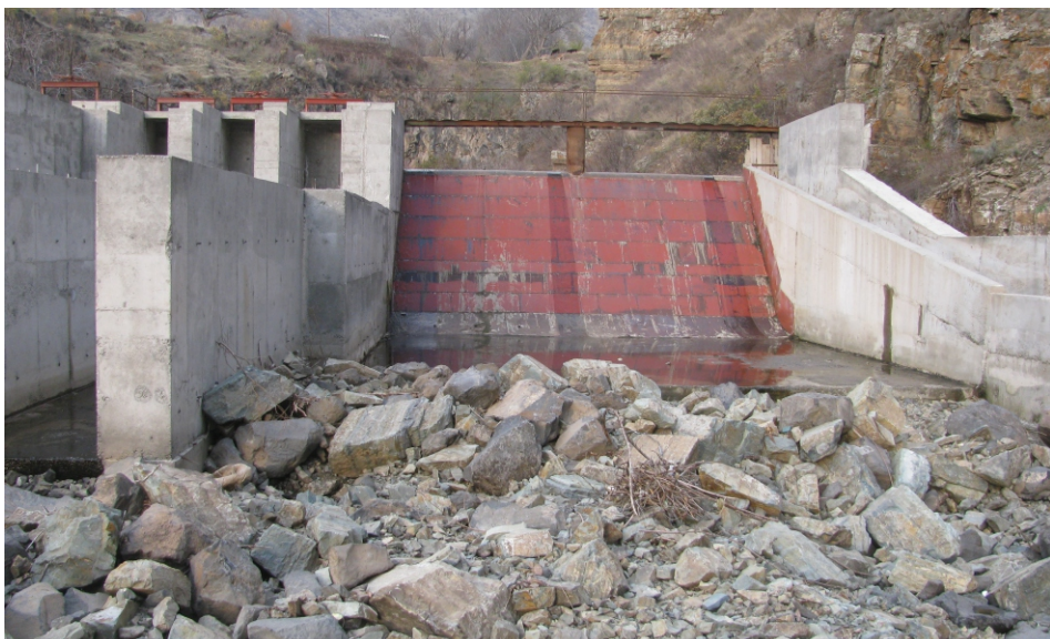
«Տիգրան Մեծ» փոքր ՀԷԿ