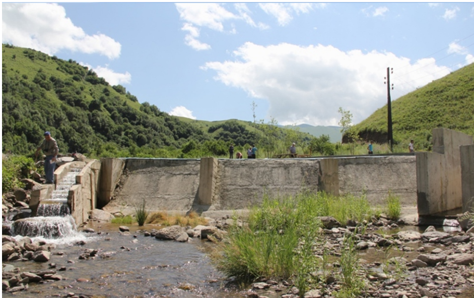
«Չորագետ 6» փոքր ՀԷԿ