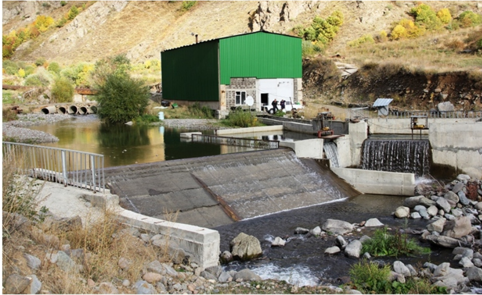
«Եղեգիս 3» փոքր ՀԷԿ-ի կայան, «Եղեգիս 2» փոքր ՀԷԿ-ի գլխամաս,