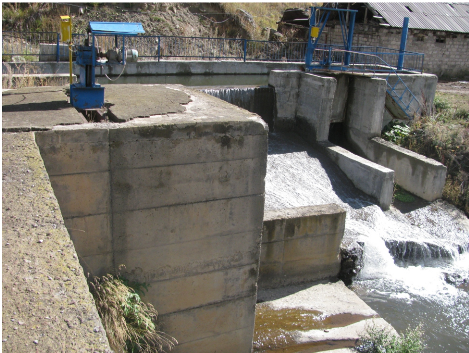
«Վարդահովիտ» փոքր ՀԷԿ