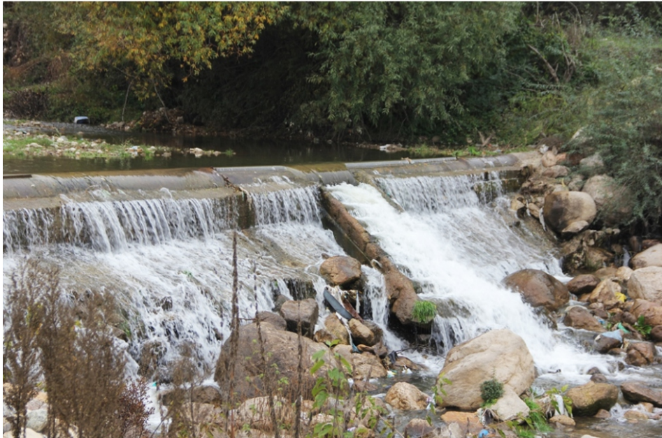
«Խաչաղբյուր» փոքր ՀԷԿ