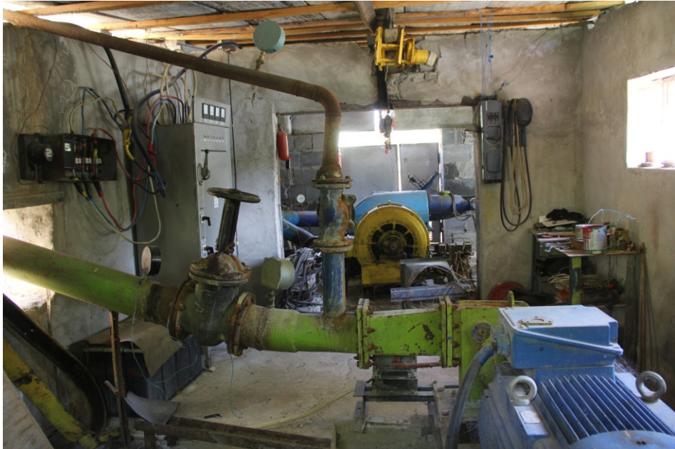
«Սմբուլ» փոքր ՀԷԿ-ի սարքավորում