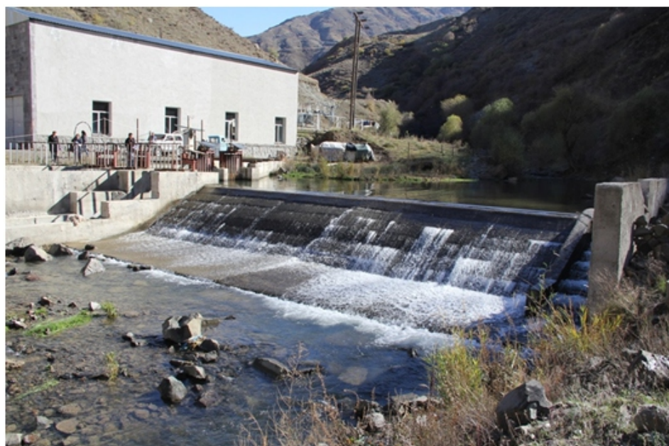
«Գողթանիկ» փոքր ՀԷԿ