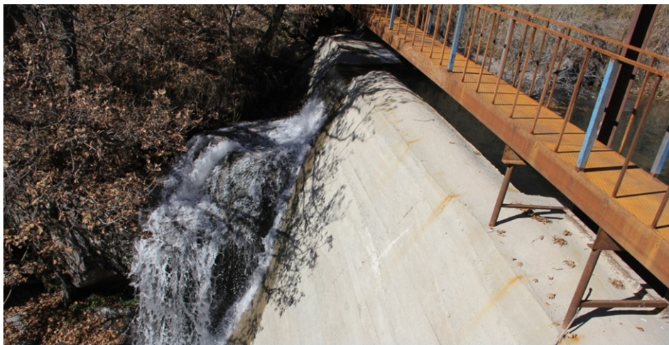
«Նանե» փոքր ՀԷԿ