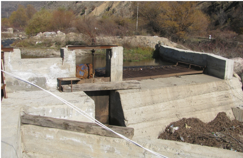
«Նժդեհ» փոքր ՀԷԿ