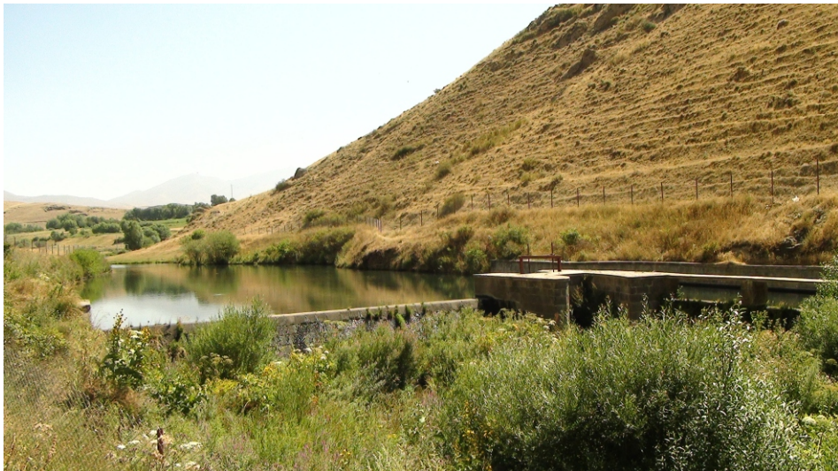
«Շաքի» փոքր ՀԷԿ