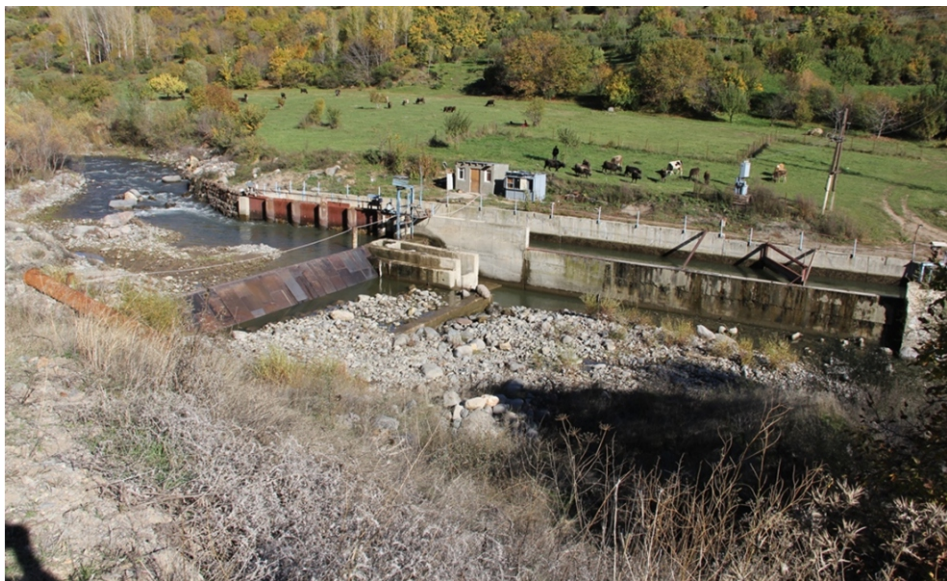
«Եղեգնաձոր», «Եղեգնաձոր ՓՀԷԿ-1» ՓՀԷԿ-եր