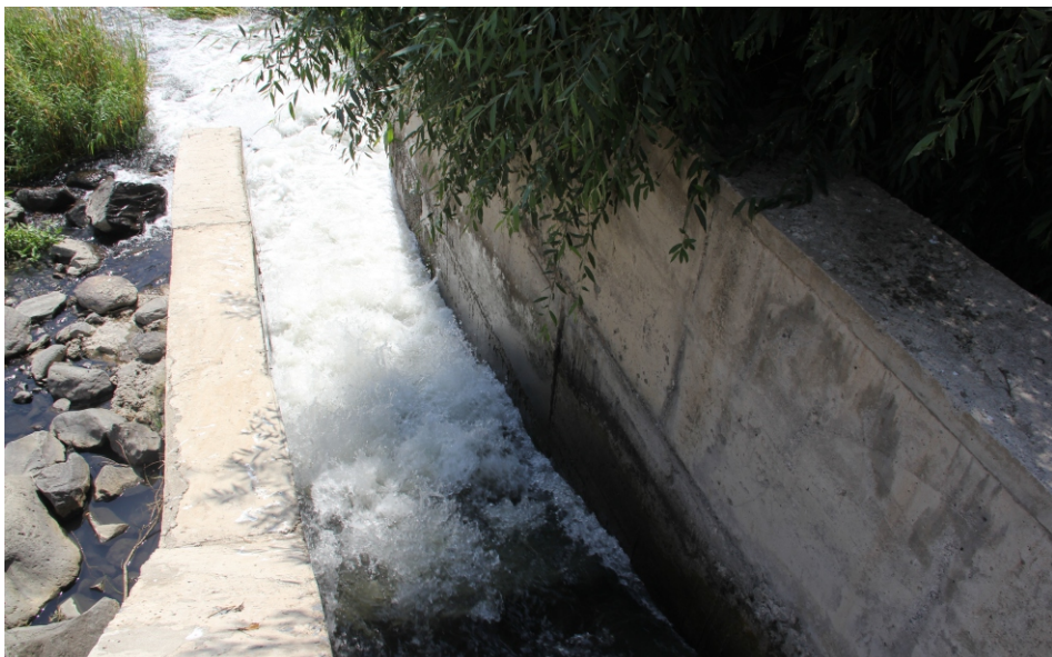
«Իշխանասար» փոքր ՀԷԿ-ի ձկնանցարան