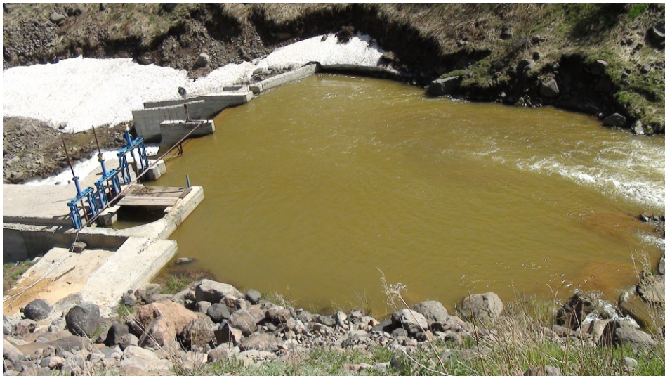
«Գեղարուտ» փոքր ՀԷԿ