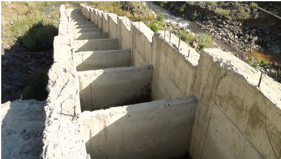
«Որոտան 7» փոքր ՀԷԿ-ի ձկնանցարան