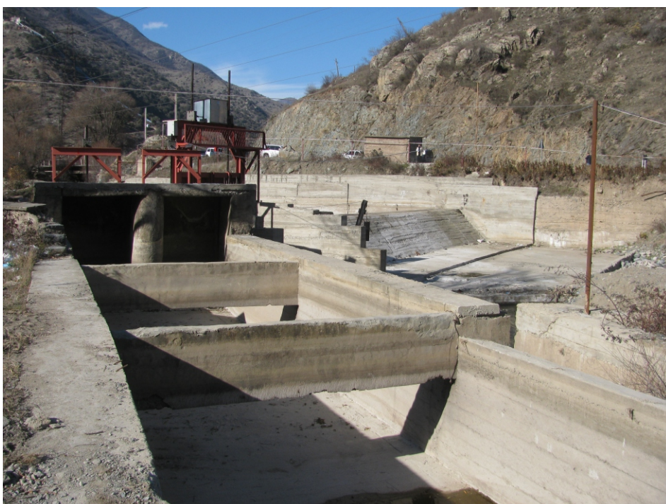
«Ողջի 1» փոքր ՀԷԿ