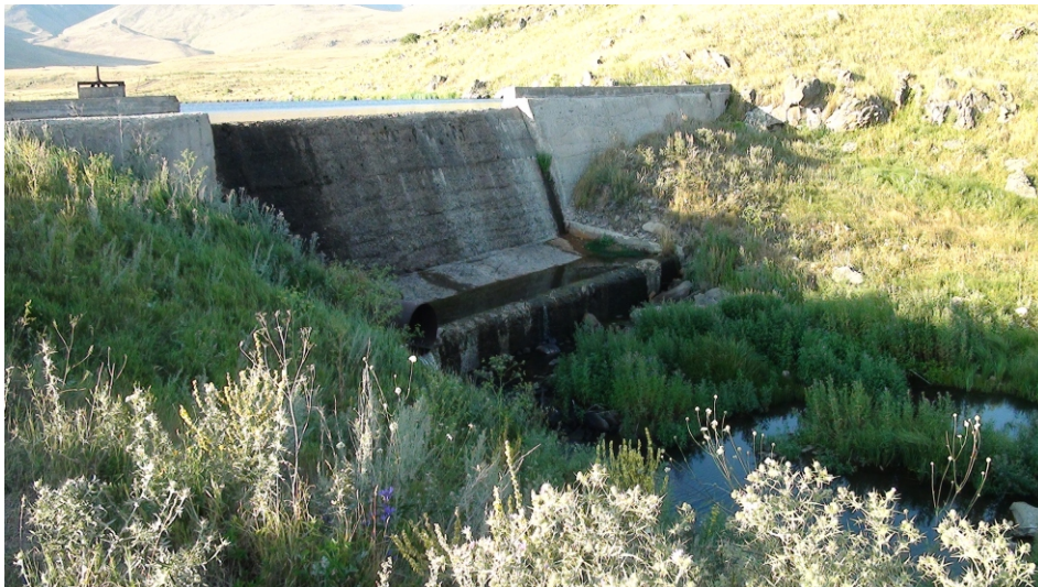
«Սանդաղբյուր» փոքր ՀԷԿ