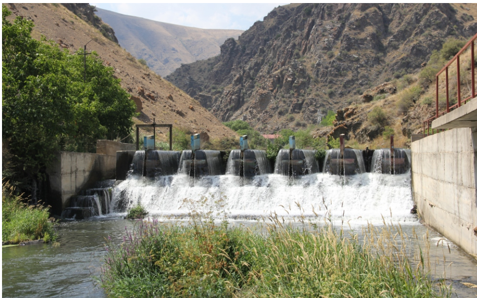
«Որոտնա» փոքր ՀԷԿ