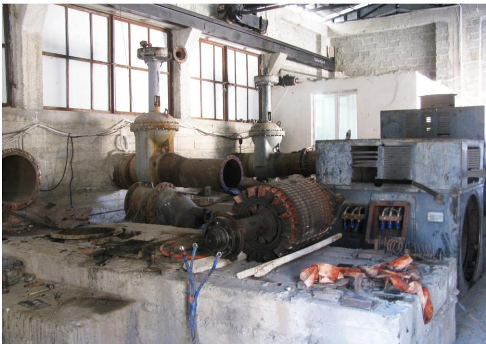
«Գեղի 2» ՓՀԷԿ-ի սարքավորում