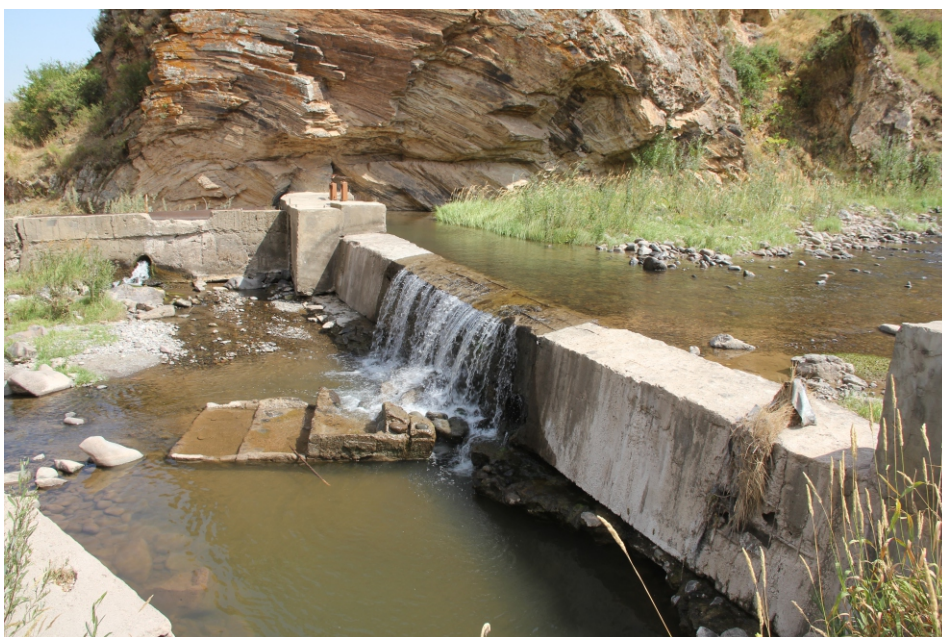
«Շաղատ» փոքր ՀԷԿ