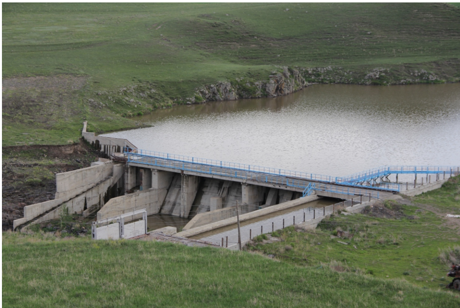
«Մարնաշեն» փոքր ՀԷԿ