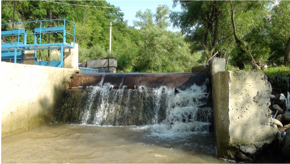
«Մարցիկետ 1» փոքր ՀԷԿ