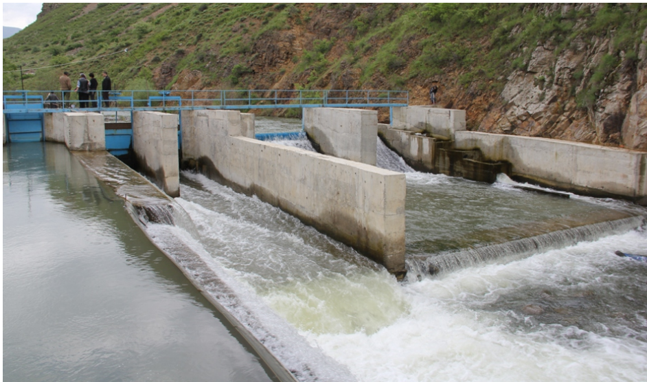
«Եղեգ» փոքր ՀԷԿ