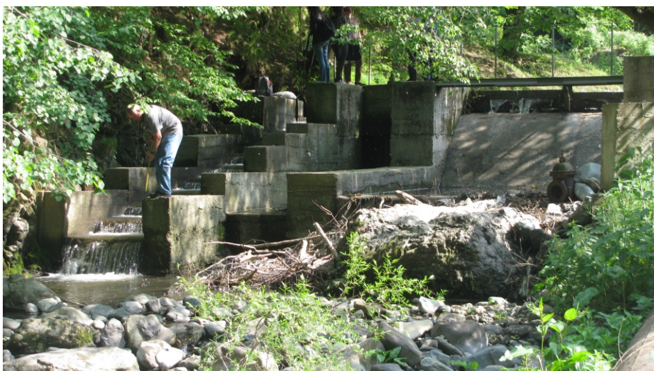
«Խաչարձան» փոքր ՀԷԿ