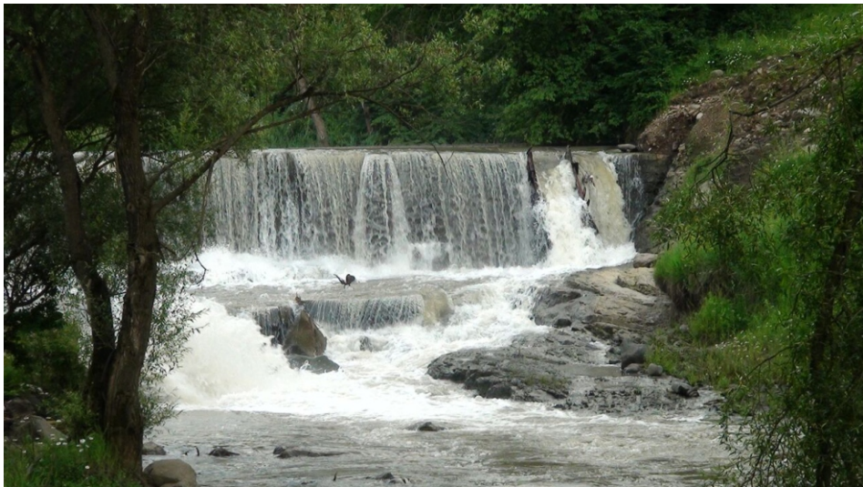
«Մարցիկետ 2» փոքր ՀԷԿ