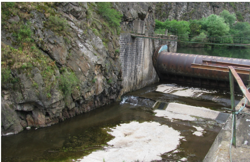
«ԶորաՀԷԿ» փոքր ՀԷԿ