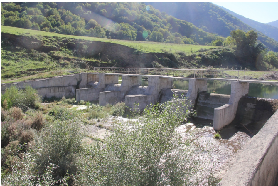
«Ծավ» փոքր ՀԷԿ