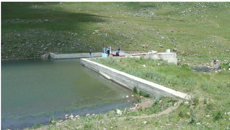
«Հեղնաջուր» փոքր ՀԷԿ