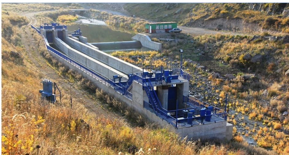
«Վարդենիկ» փոքր ՀԷԿ