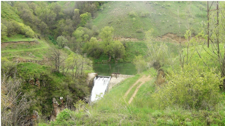
«Հերմոն» փոքր ՀԷԿ