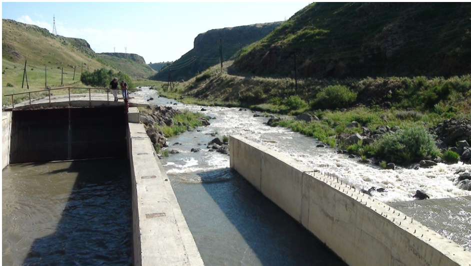
«Փարոս» փոքր ՀԷԿ