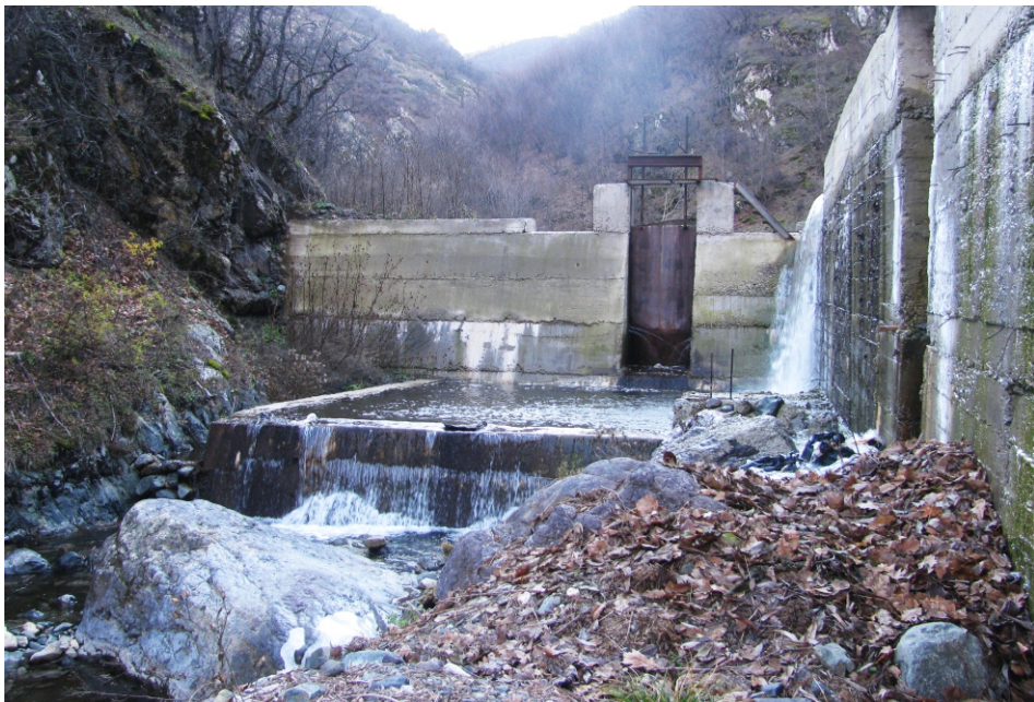
«Չագեձոր ՓՀԷԿ - 2» փոքր ՀԷԿ