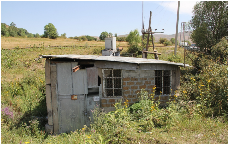
«Մանուկ» փոքր ՀԷԿ