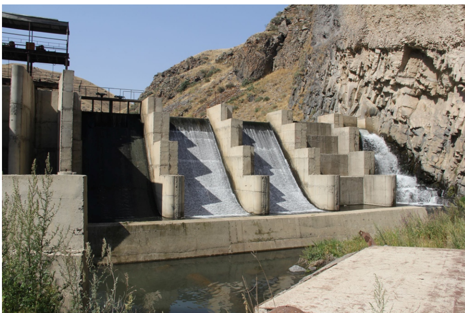
«Ապրես» փոքր ՀԷԿ