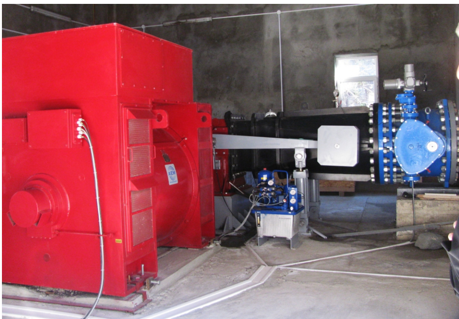
«Չագեձոր ՓՀԷԿ - 2» փոքր ՀԷԿ-ի սարքավորում