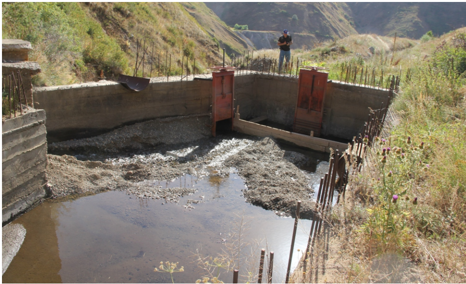
«Դաստակերտ» փոքր ՀԷԿ