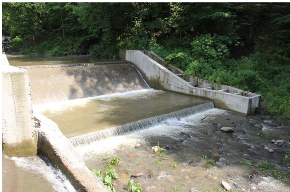
«Պոզիստրոն» փոքր ՀԷԿ