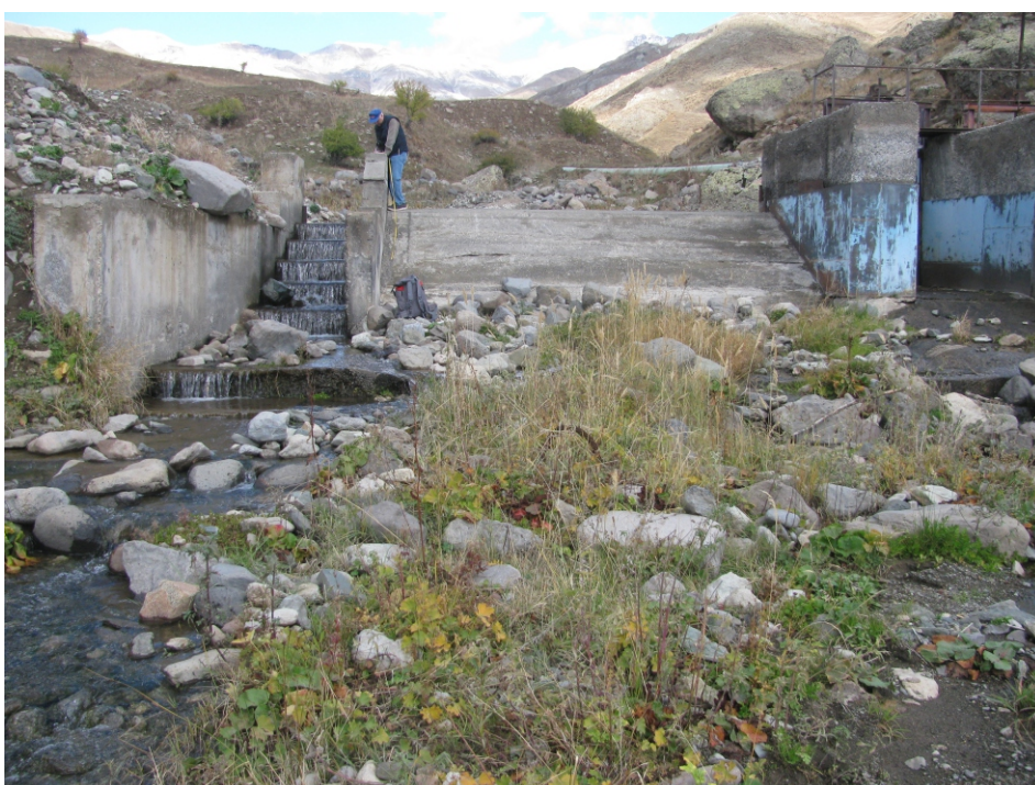
«Կարակայա» փոքր ՀԷԿ