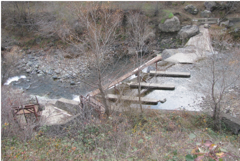
«Ողջի 2» փոքր ՀԷԿ