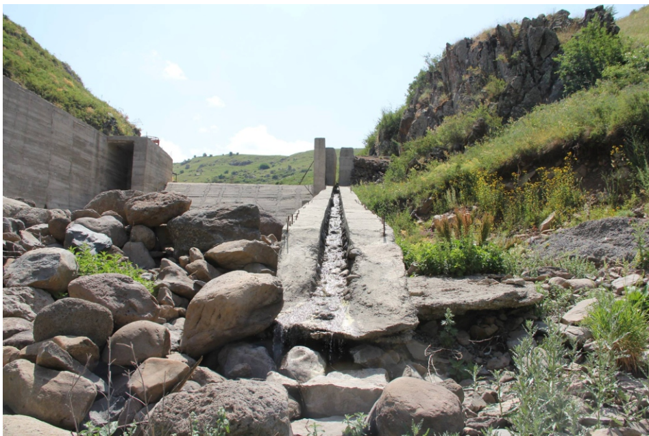
«Գողթ 1» փոքր ՀԷԿ