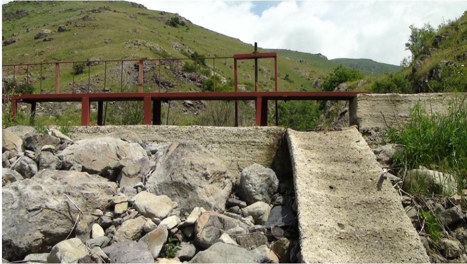
«Արջաձոր» փոքր ՀԷԿ