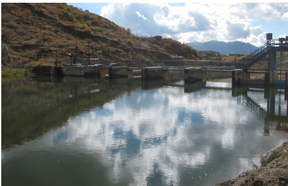
«Եղեգիս 1» փոքր ՀԷԿ