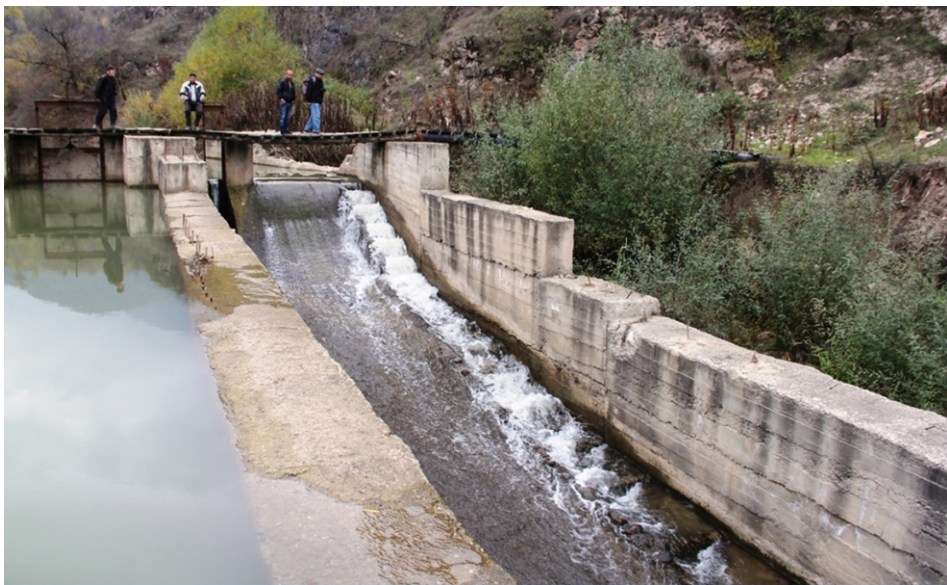
«Խաչաղբյուր 1» փոքր ՀԷԿ