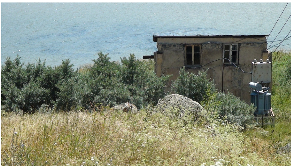
«Անգեղակոթ» փոքր ՀԷԿ