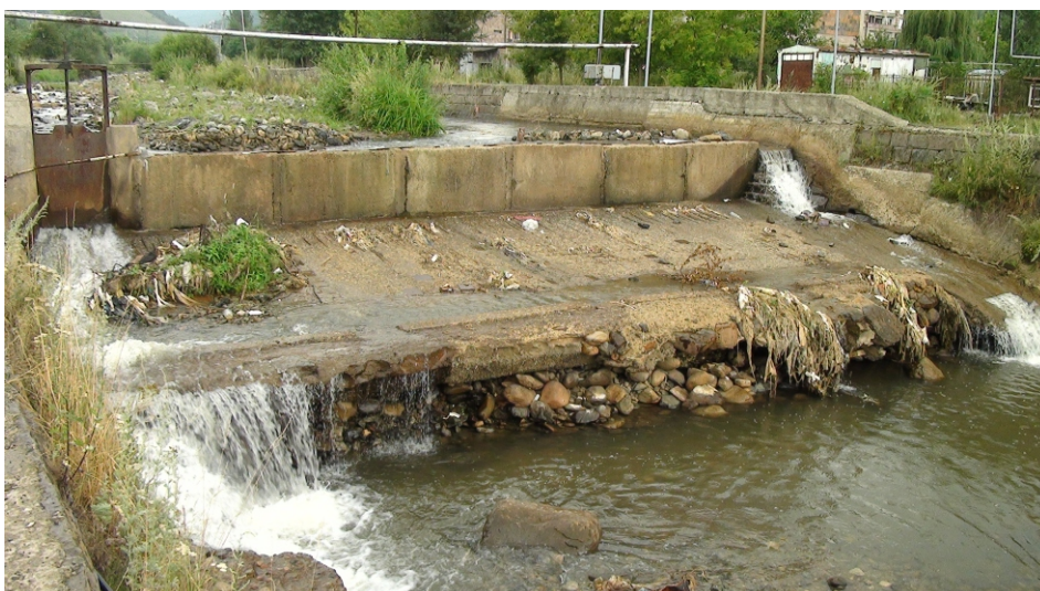
«Վահագնի» փոքր ՀԷԿ