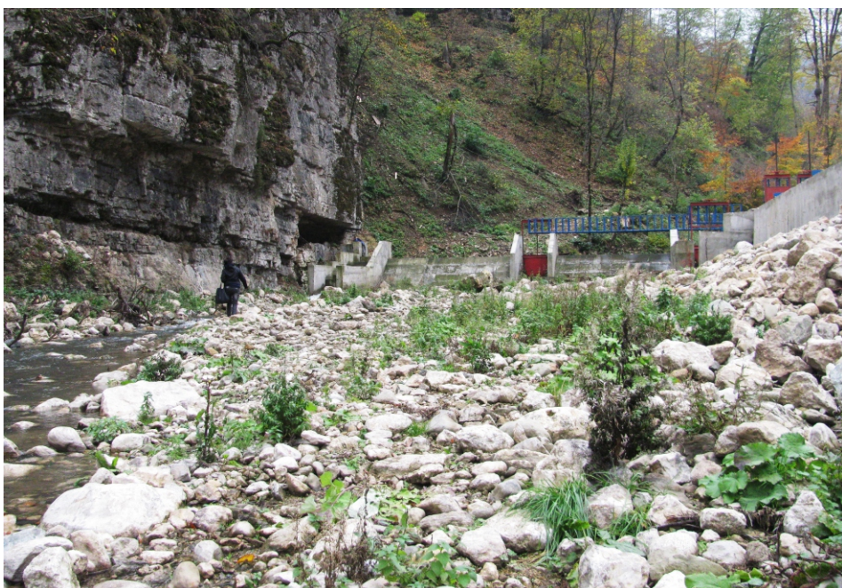
«Խաչաղբյուր 2» փոքր ՀԷԿ