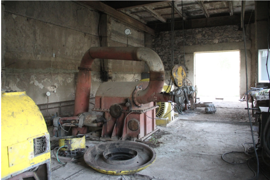
«Սանդաղբյուր» փոքր ՀԷԿ-ի սարքավորում