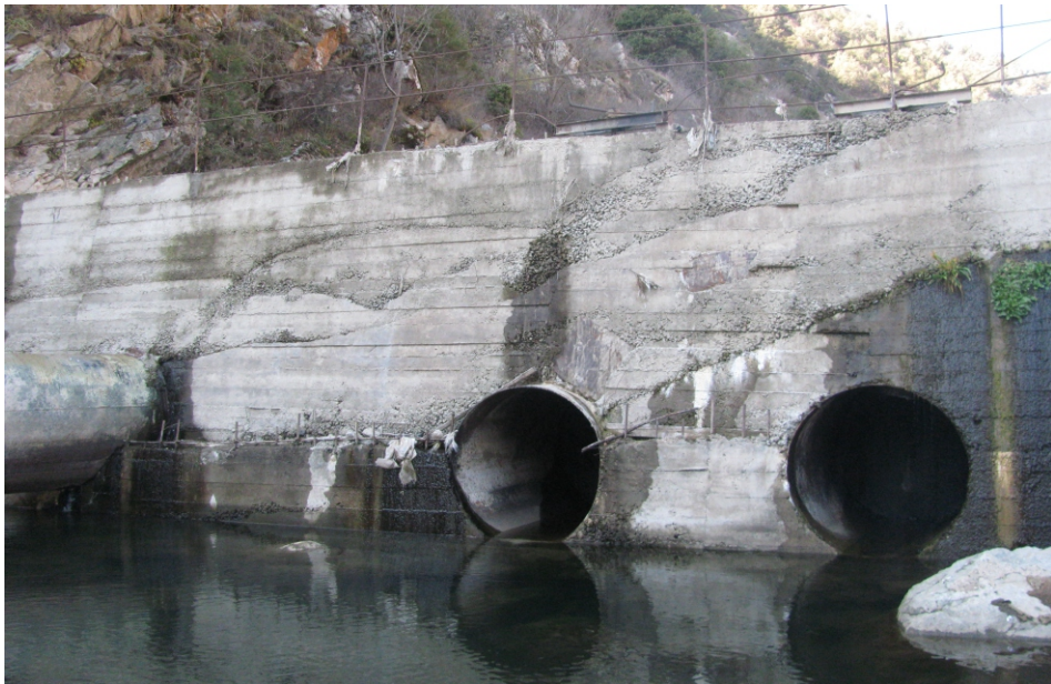
«Գեղի 2» ՓՀԷԿ