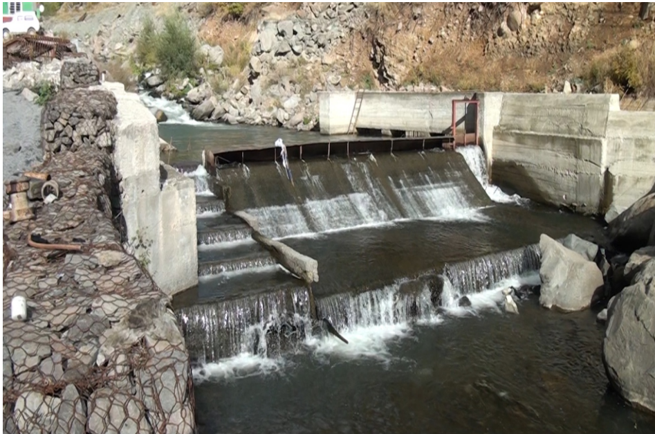
«Եղեգիս 3» փոքր ՀԷԿ