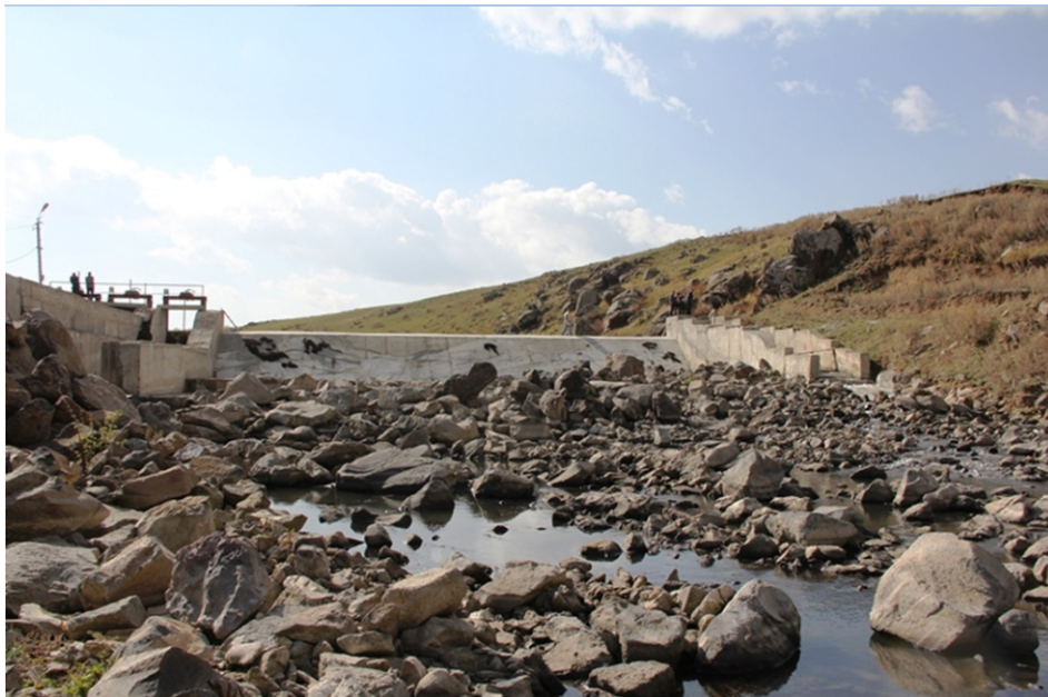
«Արգիշի» փոքր ՀԷԿ