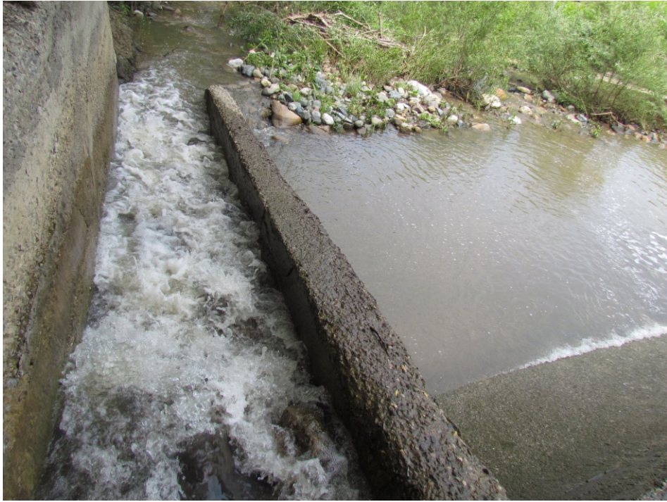
«Սիրարփի» փոքր ՀԷԿ-ի ձկնանցարան