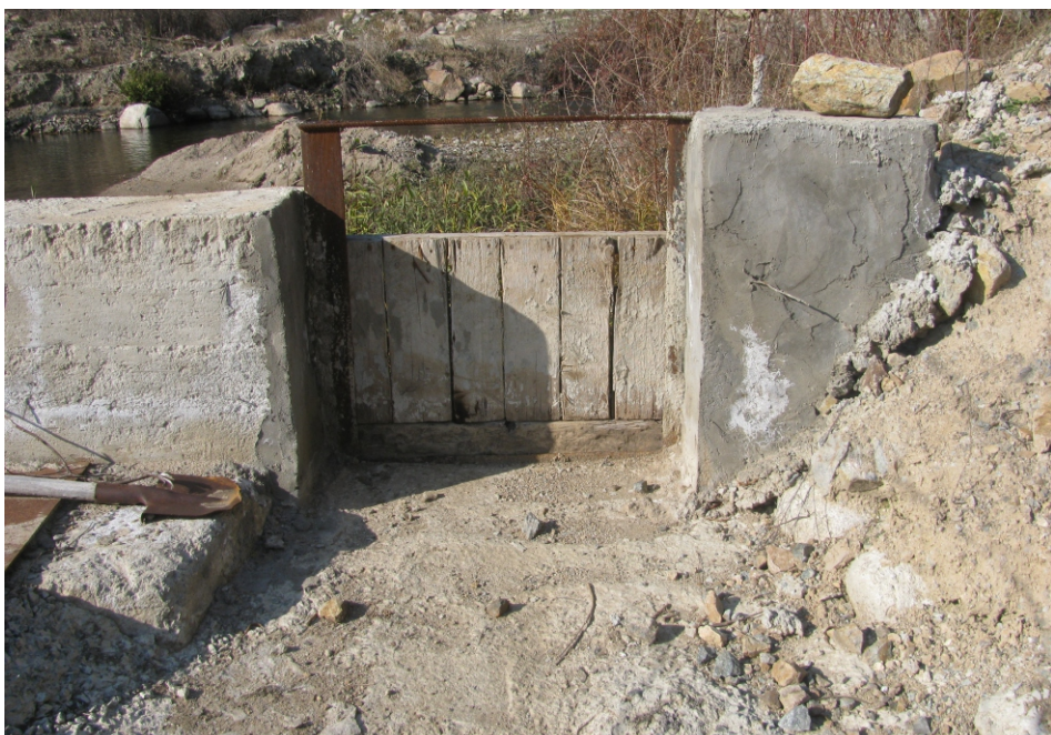
«Նժդեհ» փոքր ՀԷԿ-ի ձկնանցարան