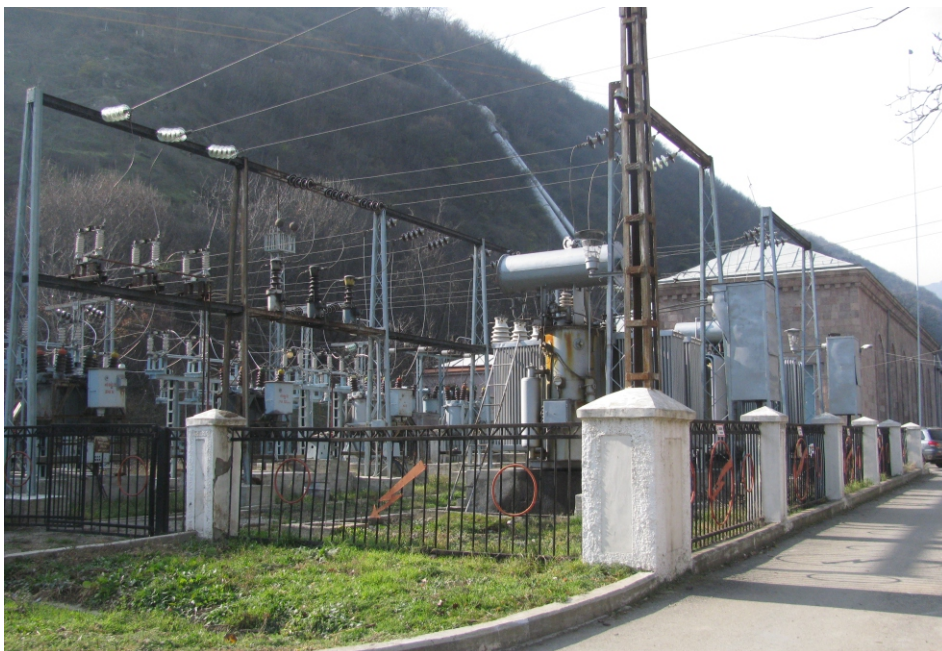
«Ողջի 3» փոքր ՀԷԿ