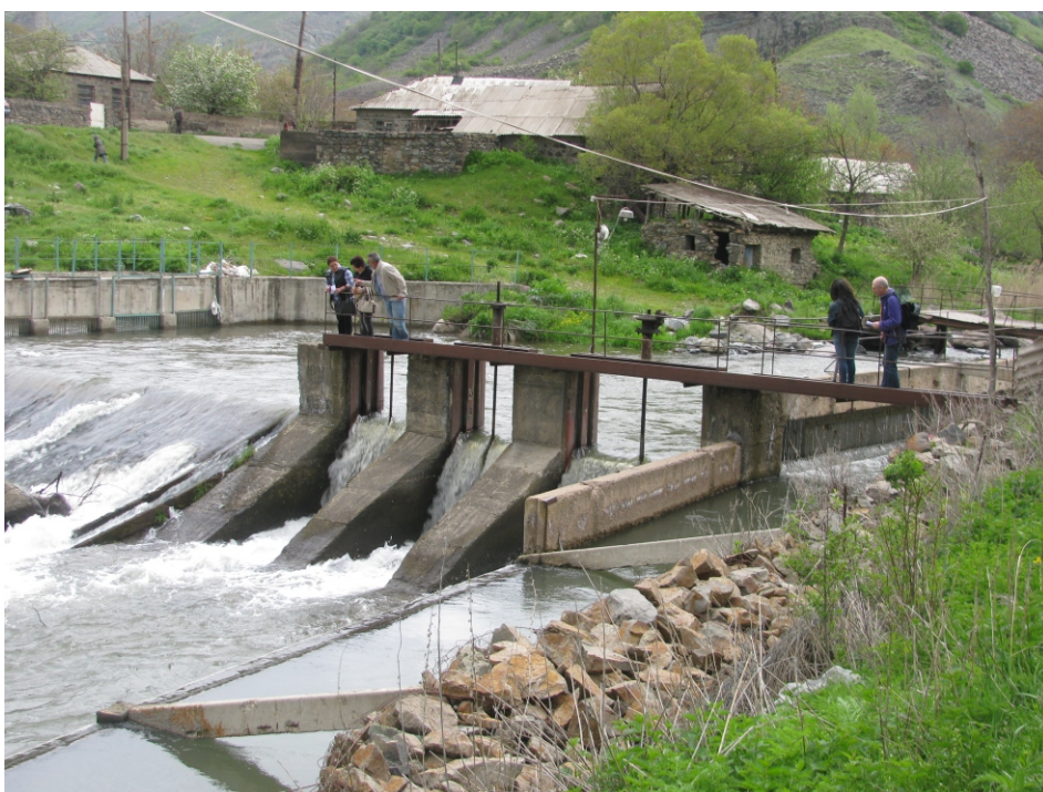
«Եղեգիս» փոքր ՀԷԿ