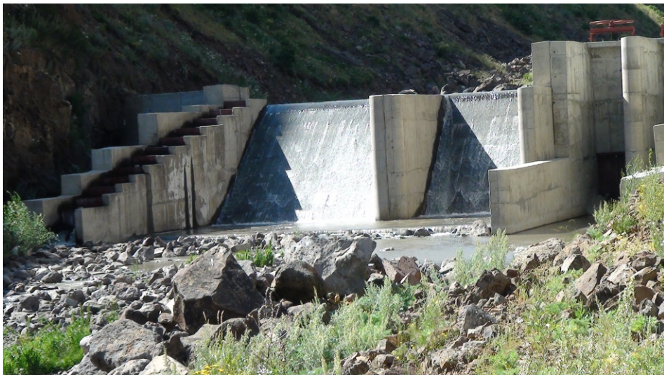
«Ամասիա» փոքր ՀԷԿ