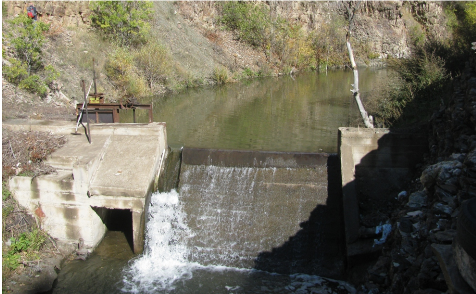
«Սանոայգ» փոքր ՀԷԿ