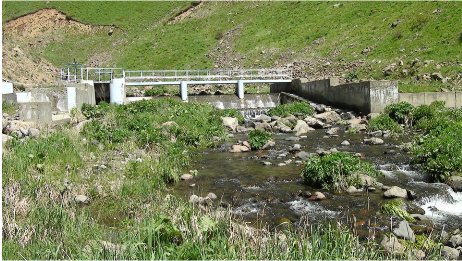
«Ամբերդ 1» փոքր ՀԷԿ