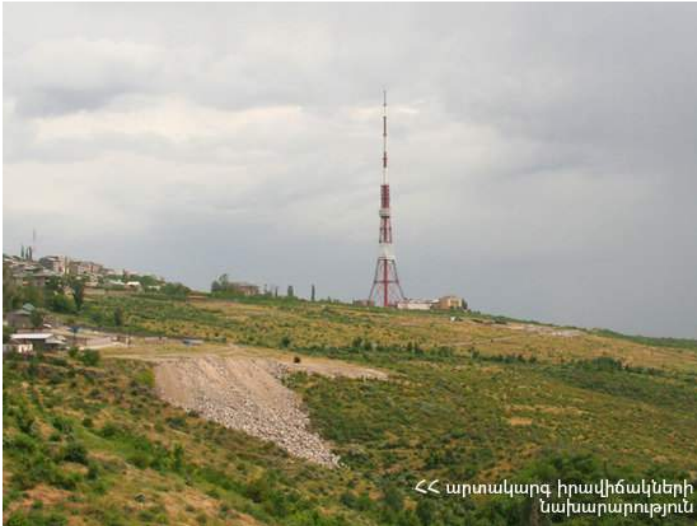
« արտակարգ իրավիճակների նախարարություն